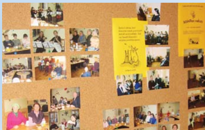
Rīgas priekšpilsētas rajonu sociālo dienestu Atvērtais durvju dienas