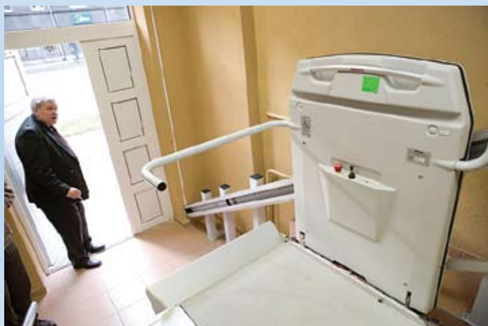
Vides pieejamība teritoriālajā centrā "Rīdzene"