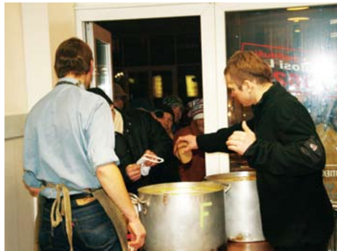
Biedrības "Žēlsirdības misija" zupas virtuve "Dzīvības ēdiens"

RD 2008. gadā finansēja divu organizāciju sniegto zupas virtuvju pakalpojumus par kopējo summu Ls 65 603.40: