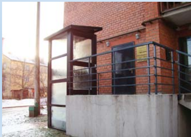
Vides pieejamība teritoriālajā centrā "Krasts"