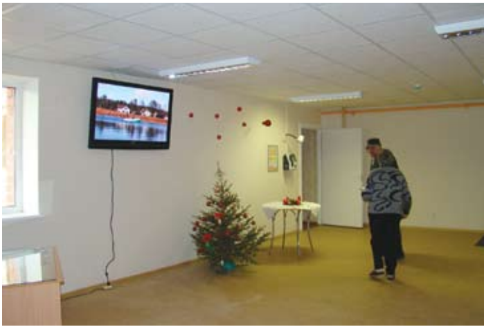
Sociālā dzīvojamā māja Rēznes ielā 10/2

Sociālās dzīvojamās mājas un sociālie dzīvokļi izvietoti dažādos Rīgas rajonos, tajās dzīvo dažāda vecuma cilvēki – gan pensionāri, gan personas ar invaliditāti, gan ģimenes ar bērniem.